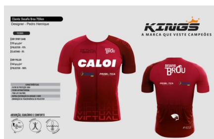
Manto 750k Bonina