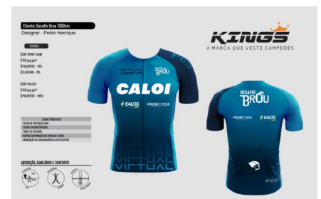
Manto 1000k Azul