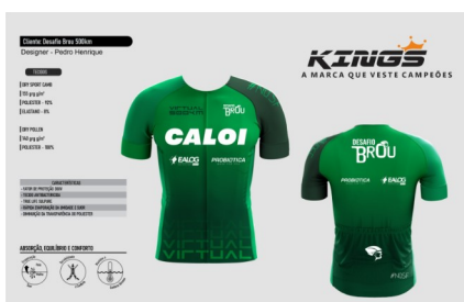
Manto 500k Verde

Premium: Uma camisa de ciclismo KINGS, uma meia e mais um item diferente a cada etapa (a ser divulgado no momento das inscrições).